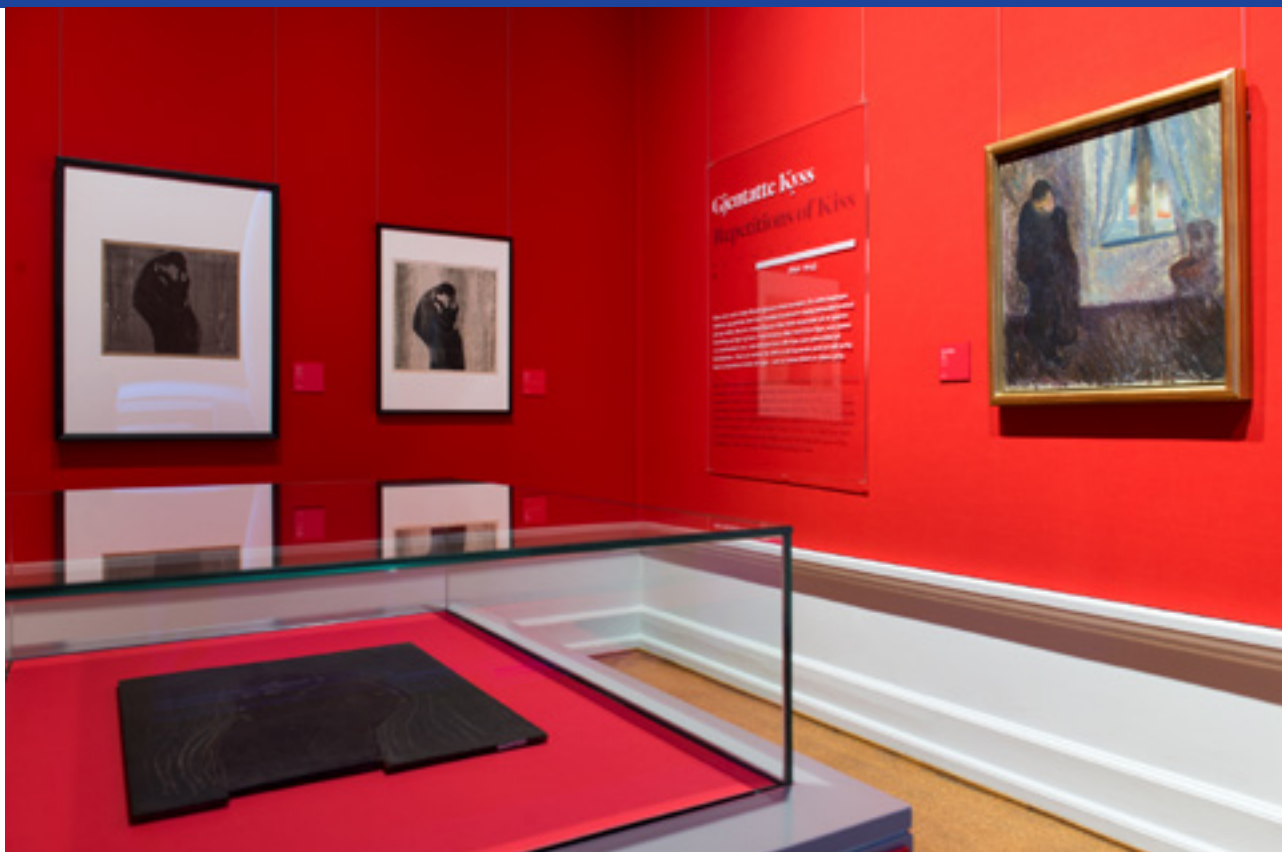
Munch gjensviterte flere av sine verk, noe som kommer godt frem i utstillingen. Bildet «Kyss» ble med han gjennom hele hans 60 år lange kunstneriske periode og er viet et eget rom på Nasjonalgalleriet.

Noen tidlige kritikere påpekte også dette. Munchs bilder inneholdt like mye oss som han selv, både på grunn av hans komposisjon, motiver og malemåte.