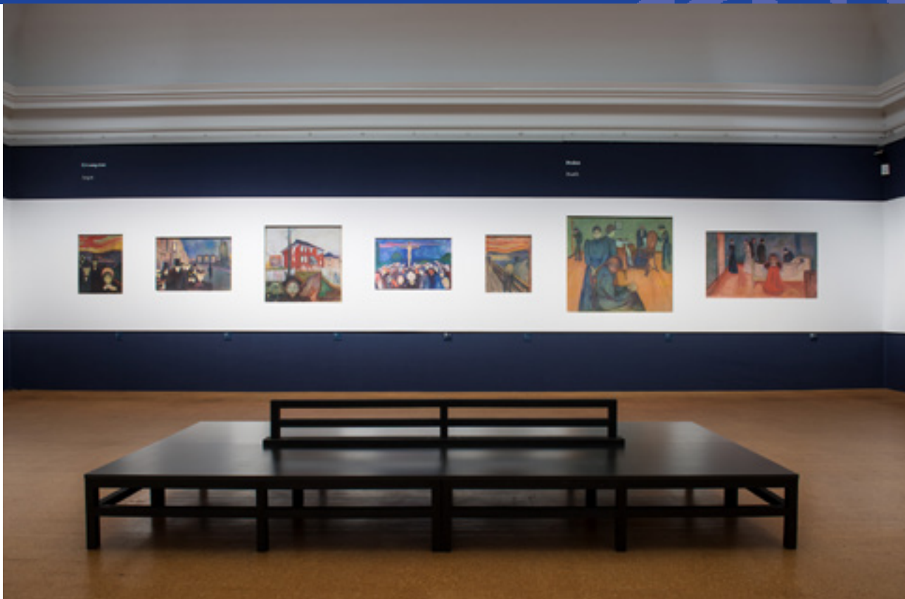
Et av høydepunktene i utstillingen er «Livsfrisen» som er en serie på 22 malerier hvor Munch skildrer angst gjennom kjærlighet og død. Serien ble stilt ut for første gang i Berlin i 1902 og er nå for første gang rekonstruert på Nasjonalgalleriet i nesten komplett form.