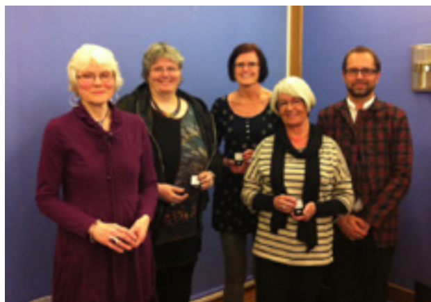
Utdeling av NTL-nål for 25-års medlemskap.

Det sittende styret ble gjenvalgt og årsmøte ble avsluttet med sosialt samvær.