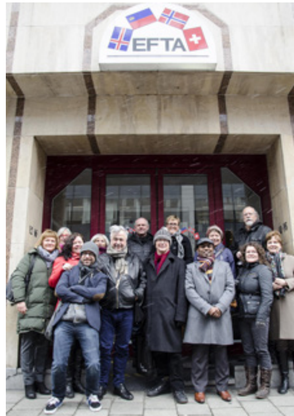
Med unntak av styret i NTL Kunst- og kulturformidling som hadde årsmøte i Helsinki, var NTL Kulturinstitusjoner godt representert i Brussel

Vi besøkte den norske EU-delegasjonen i Brussel, og ble orientert om deres arbeid i Brussel. I tillegg fikk vi også orienteringer fra en norsk ansatt i EUs omfattende kulturprogram og fra ambassadens kulturattaché.