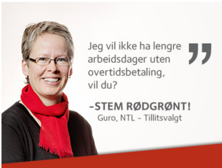
NTL - Facebook bilde sitat stor