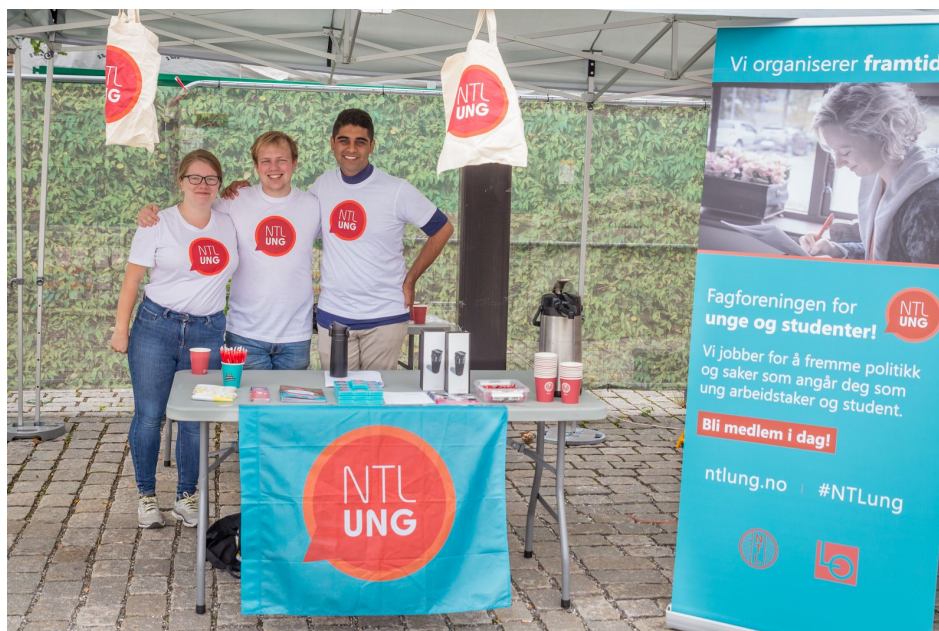
Studentgruppen i Oslo var stadig å se på stand på Blindern under studiestart