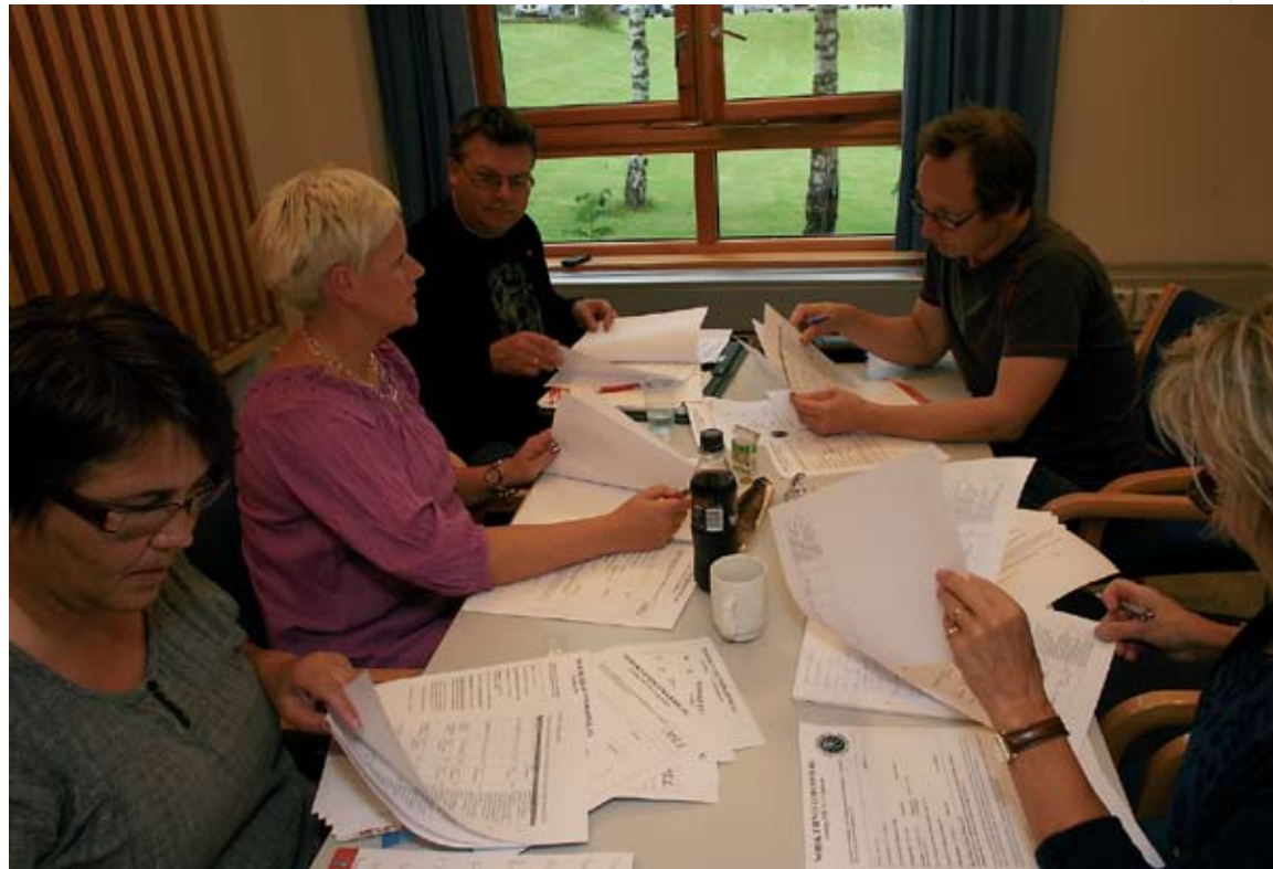
Fra kurs i lønnsforhandlinger på Sørmarka i august 2010.

– Vi har klart å oppnå noe, men ser at vi fortsatt har mye å gjøre. Dessverre er det vanskelig å få arbeidsgiver med på våre prioriteringer. De står steilt på