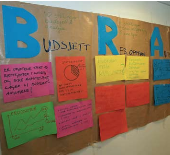
Fra budsjettarbeidet i direktoratet

2010 er, som alltid, forhåpningenes og mulighetenes år. Både for brukerne og de tilsatte i etaten. Dette året skulle være året da NAV-reformen og etaten gradvis endret fokus og skulle vri ressurser fra arbeid med etablering og organisering til økt kvalitet og bedre oppfølging av brukerne. Vi skulle leve enda bedre opp til vår ambisjon om å «gi mennesker muligheter». Vi har ennå en del igjen av året. Men vi har trøbel!