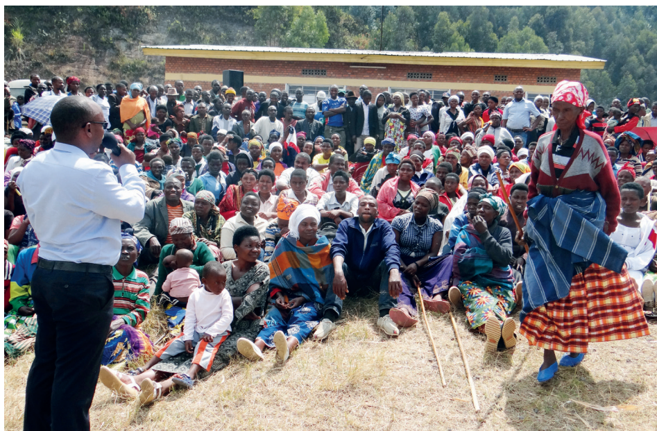
RWN driver påvirkningsarbeid for å sikre at både kvinnelige og mannlige lokale ledere fremmer likestilling og inkludering i sine samfunn.

De kvinnelige lederne er nå i stand til å bruke nyskapende metoder for å løse sine egne utfordringer så vel som problemene i lokalsamfunnet. De har tatt føringen i arbeidet for å få flere kvinner inn i lederstillinger. De lærer opp andre kvinner i sine valgkretser slik at de forstår hvilke rettigheter de har, hvordan de kan vinne folks tillit, og hvordan de kan bruke sine stemmer i lokalsamfunnet. En viktig del av dette er også å øke bevisstheten og kunnskapen om forebyggende tiltak under koronapandemien.