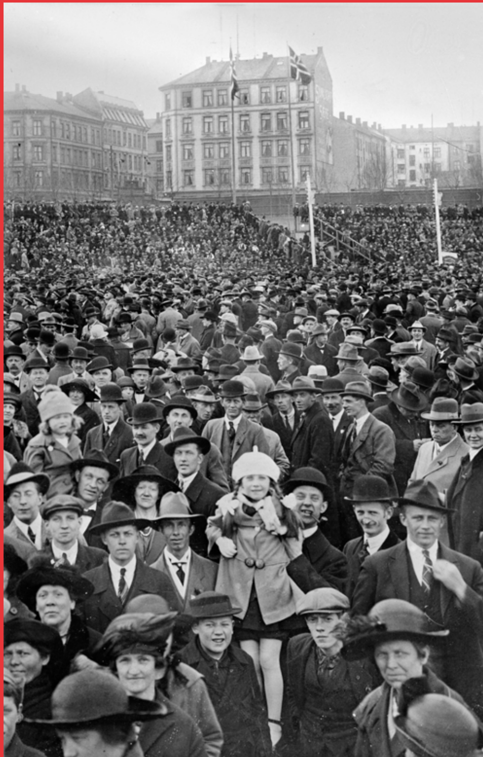
1. mai 1926 på Dæhlenengen stadion under avslutningsarrangementet etter demonstrasjonen.