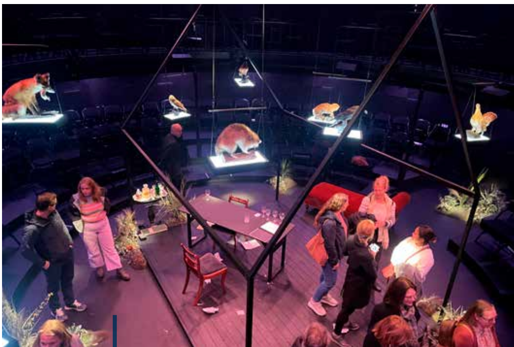
Sosialt samvær på Soria Moria.