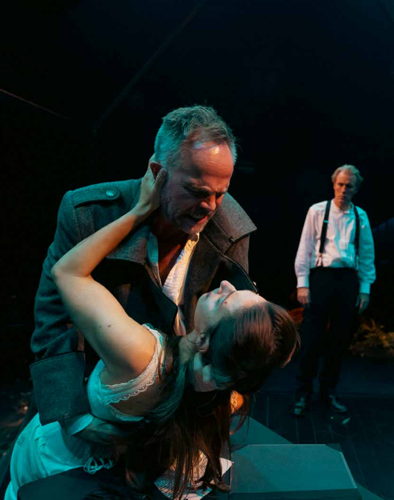
Scene fra «Dødsdansen», med Pia Tjelta, Jon Øigarden og Thorbjørn Harr.