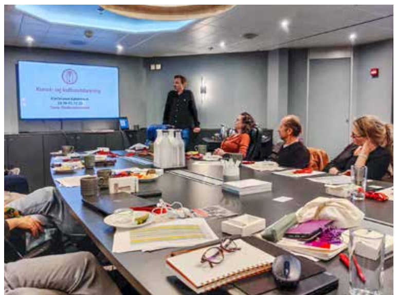
Det blev faglig påfyld både på tur og retur. Her fra torsdagens konferanserom på DFDS.