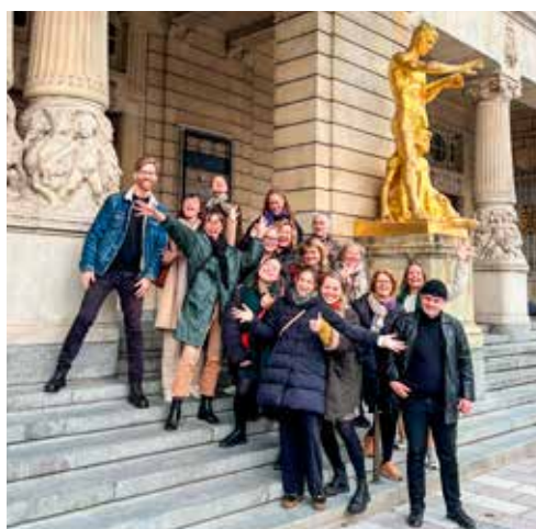
Omvisning på ærverdige Kungliga Dramatiska teatern.