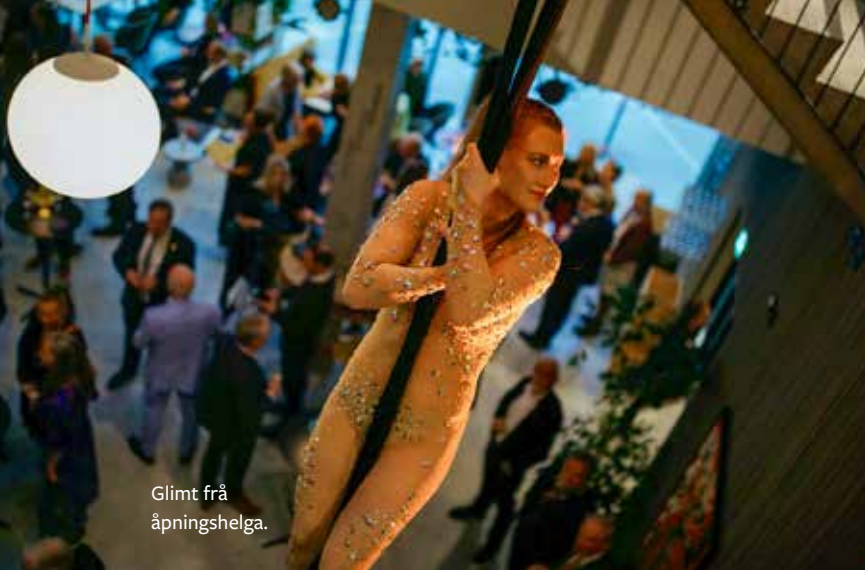
Glimt frå åpningshelga.