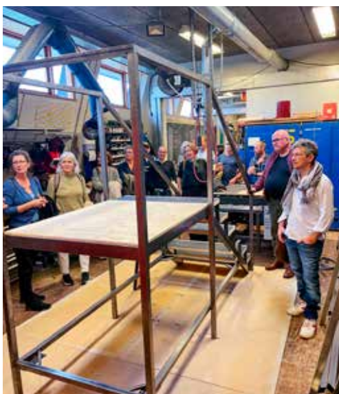
Omvising på Den Danske Scenekunstskolen.